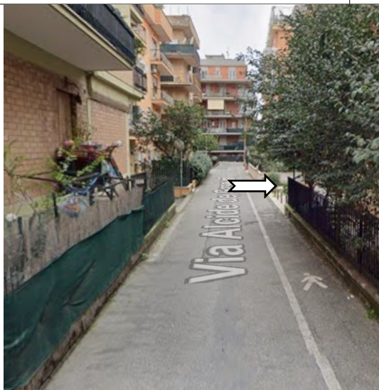
(VIA A. DE GASPERI N. 6 tratto di strada oggetto di Ordinanza)