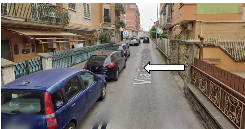
F. DE PINEDO FR. CIV. 20 (tratto interessato dall'Ordinanza)

A norma dell'Art. 43 comma 5 del codice della strada, il personale del Comando di Polizia Locale e le altre forze dell'ordine, hanno facoltà di intraprendere qualsiasi iniziativa anche se in contrasto con la segnaletica esistente, ovvero con le norme di circolazione, al fine di fronteggiare e risolvere situazioni contingenti.