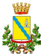
Comune di Lavagna