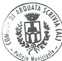
Il Sindaco (Alberto Basso)