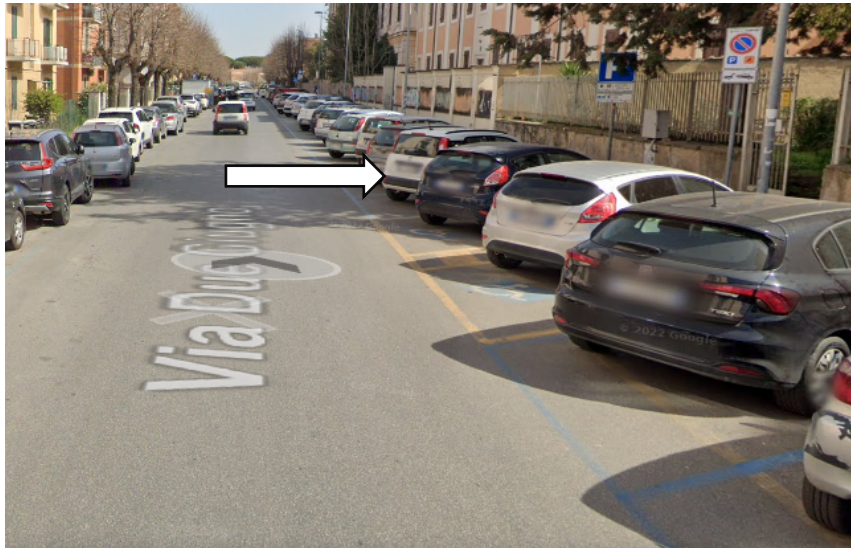
(tratto di strada oggetto di Ordinanza)

A norma dell'Art. 43 comma 5 del codice della strada, il personale del Comando di Polizia Locale e le altre forze dell'ordine, hanno facoltà di intraprendere qualsiasi iniziativa anche se in contrasto con la segnaletica esistente, ovvero con le norme di circolazione, al fine di fronteggiare e risolvere situazioni contingenti.